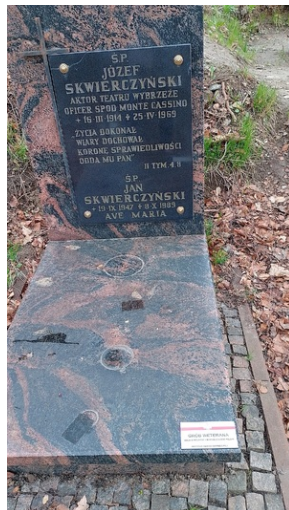
Oddział IPN w Gdańsku oznakowało kolejne mogiły tabliczką Weterana Walk o Wolność i Niepodległość Polski - 5 kwietnia 2024