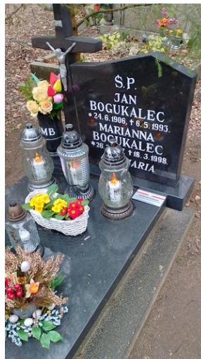
Oddział IPN w Gdańsku oznakowało kolejne mogiły tabliczką Weterana Walk o Wolność i Niepodległość Polski - 5 kwietnia 2024